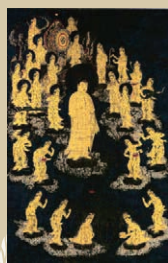
阿弥陀二十五菩薩来迎図 鎌倉時代、京都・三千年

令和6年10月5日(土)~12月1日(日) 前期/10月5日~10月30日 後期/11月2日~12月1日 ※10月2~4日、10月31日~11月1日、12月2~4日は展示替えのため休館 東塔地域 国宝殿