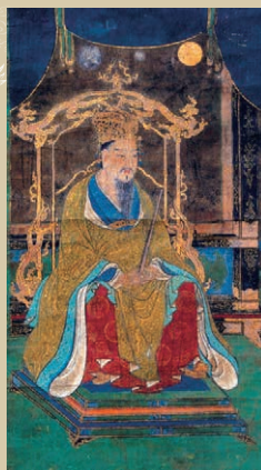
桓武天皇像 室町時代(16世紀)、滋賀・延暦寺