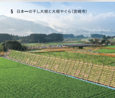
5 日本一の干し大根と大根やぐら(宮崎市)