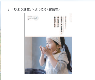
6 「ひより食堂」へようこそ(霧島市)