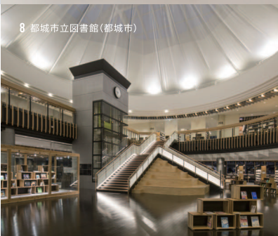
8 都城市立図書館(都城市)

1) パーソナルモビリティ「WHILL Model A」2015年度大賞 2) レコードプレーヤー「SL-10」1980年度大賞 3) 醤油注「G型しょうゆさし」1961年度 4) トング「おてがるトンク」2023年度グッドフォーカス賞 [技術・伝承デザイン] 5) 農産物「日本一の干し大根と大根やぐら」2020年度ベスト100 6) レンビ本「ひより食堂」へようこそ 小学校にあがるまでに身に付けたいお料理の基本」2020年度金賞 7) 音声認識システム「YYSYSTEM」2023年度金賞 8) 図書館「都城市立図書館」2018年度 ※各年度はグッドデザイン賞受賞年