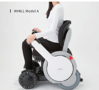
1 WHILL Model A

本展が私たちの暮らしを豊かにするデザインの魅力や価値に触れる機会となれば幸いです。